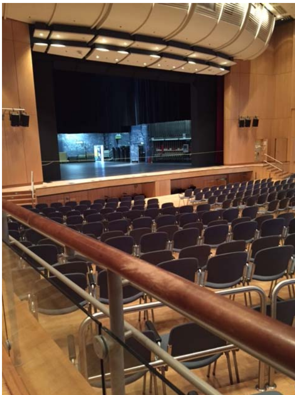
(Blick von der linken Seite)