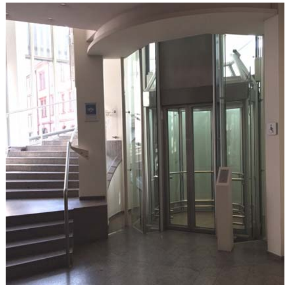
(Aufzug zum Kirchner Saal)