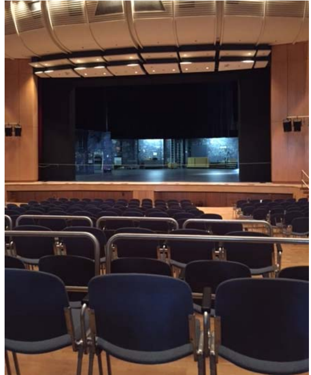
(Blick von Reihe 17 rechts)