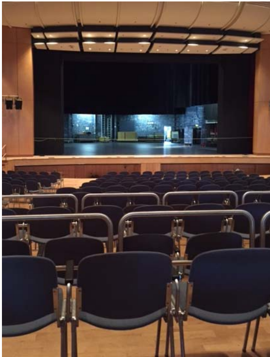
(Blick von Reihe 17 links)