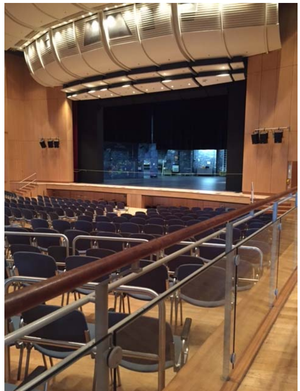
(Blick von der rechten Seite)