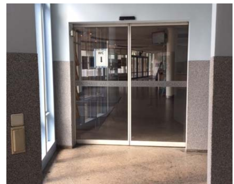
(Automattür in die Stadthalle)